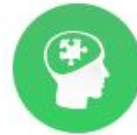
Kiemelt témakörök (tematika)