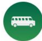
Diákok helyszíni látogatása